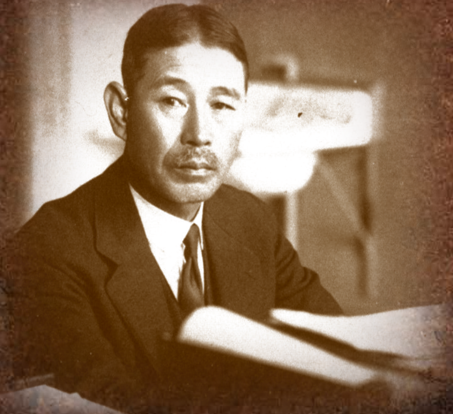
東北帝国大学 数学科初代教授 藤原松三郎